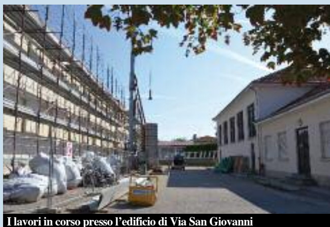
I lavori in corso presso l'edificio di Via San Giovanni

Il progetto dell'arch. Rossella Cuncu di Ceva, presentato in Regione a febbraio, nell'ambito del Piano Triennale di Edilizia Scolastica 2015-2017 emanato dallo Stato in data 21 gennaio, una volta realizzato cambierà totalmente l'area delle scuole. Prevede infatti innanzitutto l'abbattimento della vecchia palestra (non ha più gli standard richiesti dalla legge, non può più essere messa a norma ed i suoi costi di gestione e di manutenzione sono ormai insostenibili) e poi la costruzione di una nuova palestra strutturalmente collegata all'attuale edificio scolastico lungo l'asse di Via Ceretta (così gli alunni non dovranno più uscire dall'edificio principale per andare in palestra). E' prevista una costruzione su due piani, con tutti gli