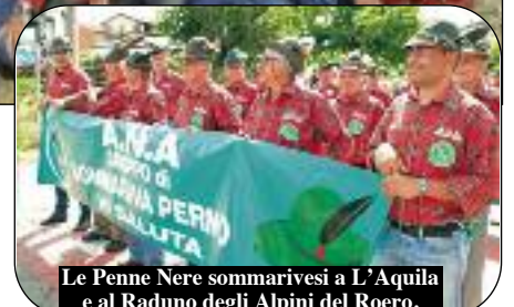
Le Penne Nere sommarivesi a L'Aquila e al Raduno degli Alpini del Roero.