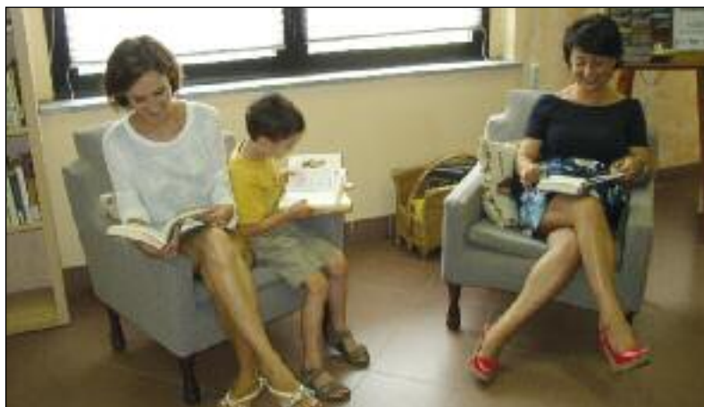
L'"angolo lettura" con le poltrone rimesse a nuovo grazie alla generosità della ditta Massimo Bertolusso.

Ci sono sempre più persone che gentilmente intendono offrirci libri usati. Proprio perché lo spazio ci manca, desideriamo lanciare un appello: chiediamo di non portare pacchi di libri di nessun tipo senza aver prima preso accordi con noi (c'è qualcuno che continua in modo anonimo ad appendere borse alla maniglia della porta d'ingresso). Non possiamo accettare donazioni in modo indiscriminato; chi davvero desidera aiutarci, venga a proporci un elenco dei libri che intende regalare alla biblioteca, alla quale non servono volumi vecchi, ma libri nuovi o pubblicati da poco tempo, che non siano ancora presenti nel nostro catalogo e che trattino argomenti adatti ad un servizio pubblico.